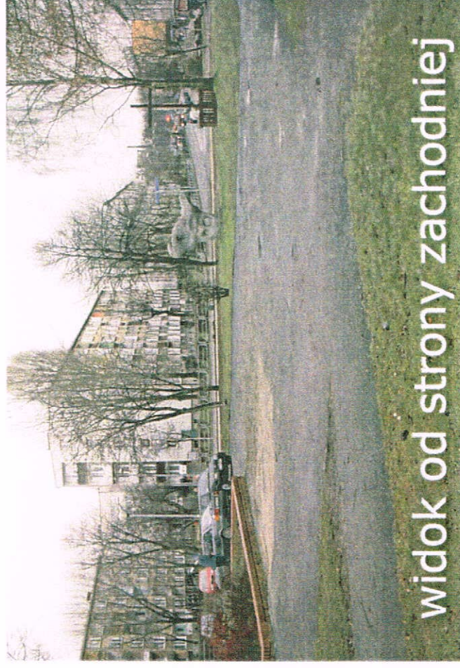
widok od strony zachodniej