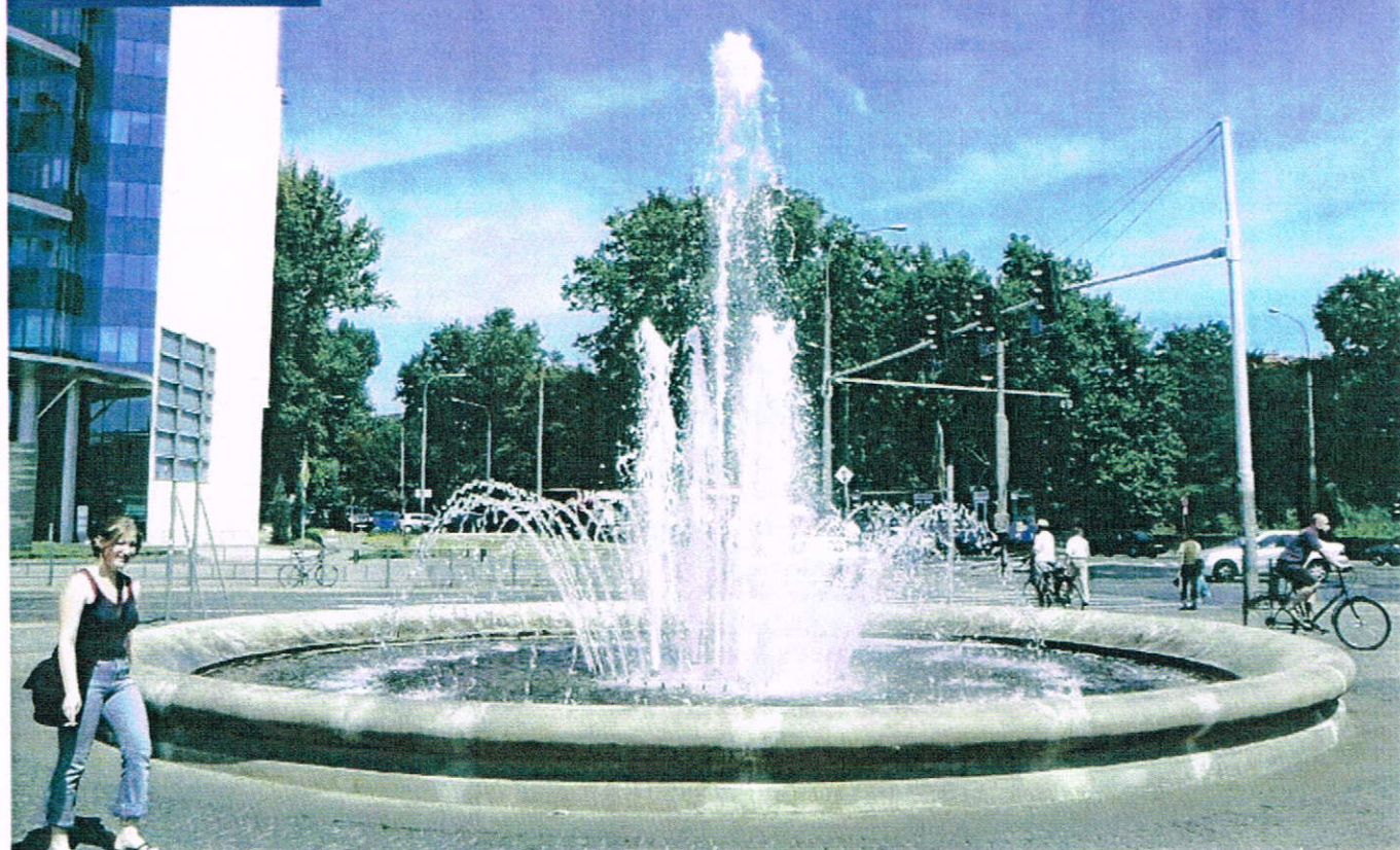
Widok fontanny w dzień