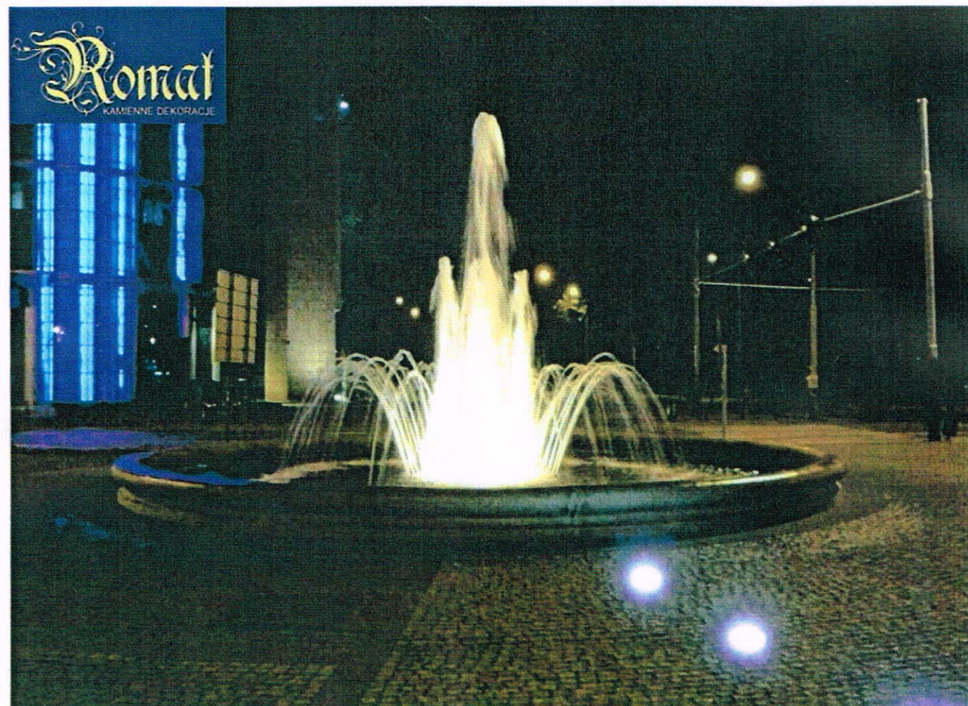
Widok w porze wieczorowej